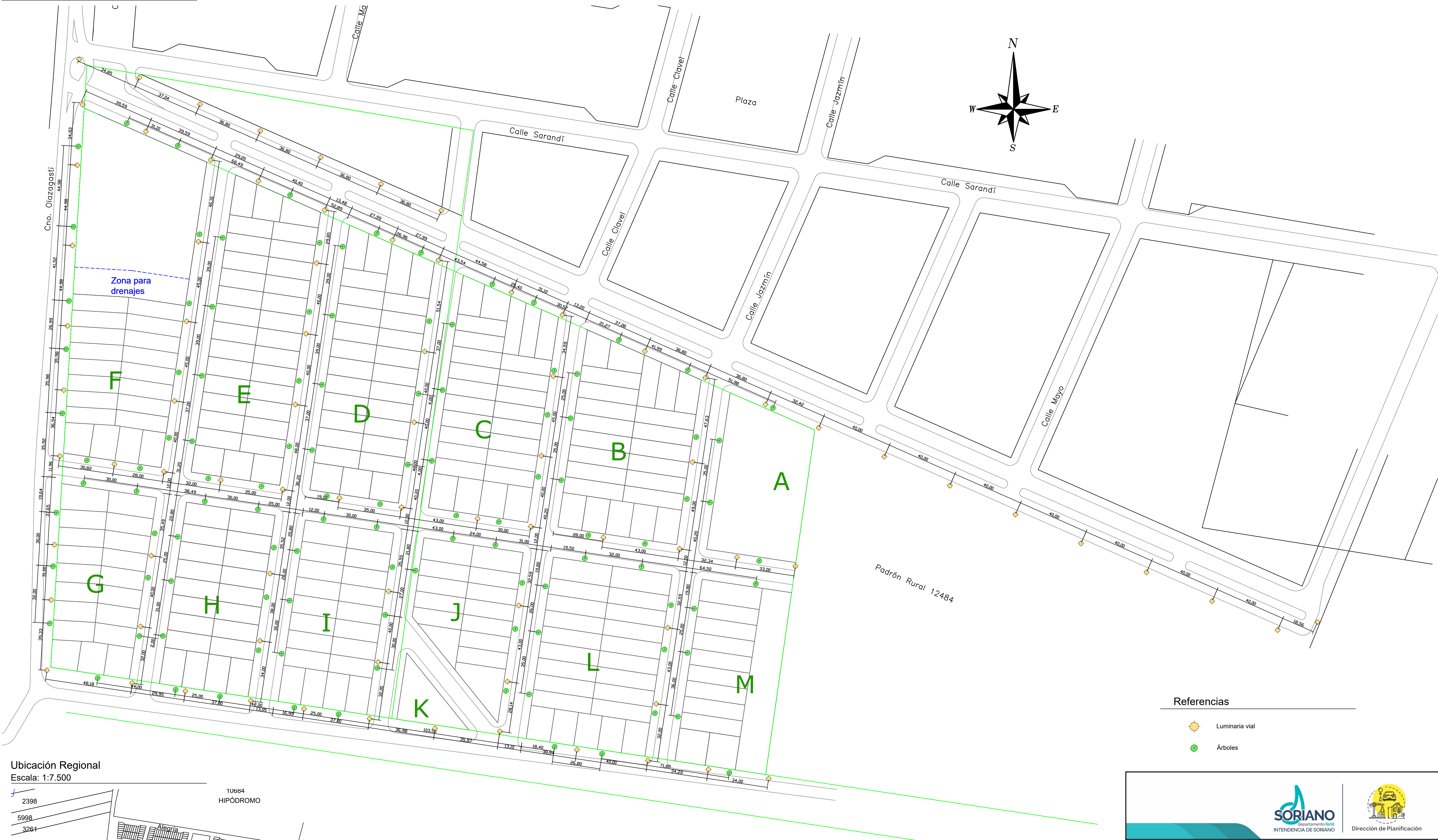
Ubicación Regional Escala: 1:7.500